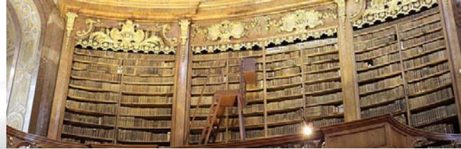
Bild:Prunksaal Hofbibliothek Wien

Das Digitale Archiv für Familiengeschichte (DAFFG) fördert den Betrieb einer Internetplattform (FamilienWIKI) zur Sammlung und Verbreitung von Informationen und Dokumenten genealogischer und Familiengeschichtlicher Art. Unter Berücksichtigung aller Möglichkeiten einer digitalen Langzeitarchivierung sollen historische Dokumente und Biografien für kommende Generationen erhalten bleiben.